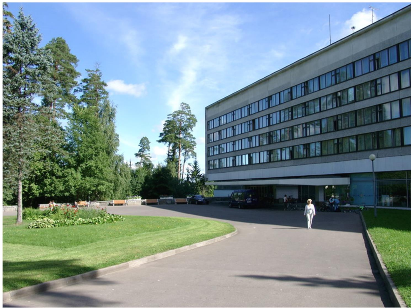
Главный корпус 1982 год

Итак, пансионат «Лесные дали» был открыт и принял самых первых отдыхающих 9 мая 1965 года, в день двадцатилетия Победы советского народа в Великой Отечественной войне.